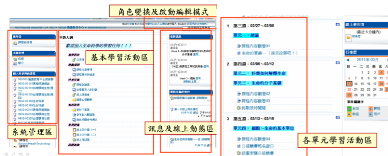
圖一、課程學習管理系統建置

本課程將主題區塊右側規劃為「訊息及線上動態區」，依課程需求使用到的功能有：最新訊息(提示公佈欄由教師或助教最近發布的公告，同時會寄送到每位修課同學的 e-mail 信箱中)、即將來臨的事件(提醒使用者一週內的教學活動通知，例如線上測驗或交作業的開始和結束時間)、行事曆(教師或助教可將教學活動日期輸入課程事件中，提醒學生，學生點選行事曆中被標示出來的日期，可以看到詳細的事件描述)。另外，線上使用者和簡訊功能，方便老師和學生清楚知道同時在線上的參與者有哪些人，可以利用簡訊方式，在線上進行討論、問答等即時交流互動，例如，學生在進行線上課程觀看時遇有問題，就可以向同時也在線上的教師或同學以簡訊方式提問。簡訊功能也可以在接收者離線狀況下使用，訊息會寄送到接收者的 e-mail 信箱。根據筆者的經驗，以上訊息提示功能有助於進行非同步遠距教學時，讓學生即時掌握重要的學習活動時程，而即時的線上互動也可以拉近教學者與學生間的距離。