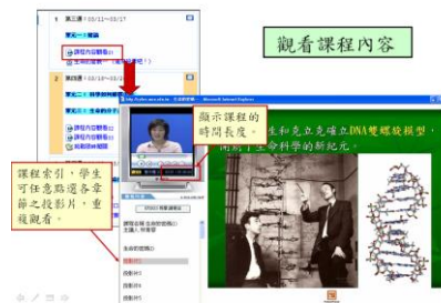
圖二、隨選視訊的課程內容觀看

片。每個單元的播放時間長度為三十分鐘至一小時不等。錄製方式是攝影棚拍攝加後製作。清晰的文字說明(避免字體太小或排列過於擁擠、控制一張投影片中有多適當字數、標題式和塊狀描述性文字並用)、豐富的圖片配合文字(解說式圖片、情境式圖片)和設計對話的效果(加強投影片文字描述表達、納入學生的想法和可能性、配合相關之影片導引議題、配合教學網站討論區進行)是教材製作的三大方向和原則。配合每個單元也提供相關的實例或實驗操作影片,加強學生的學習。這兩個部分都是從 Moodle 平台對外連結到串流影音系統,使用者可邊下載邊播放,有效節省頻寬及系統負荷。課程觀看距隨選視訊功能,透過 PPT 索引,學生可任意點選各章節之投影片,跳躍或重複觀看。