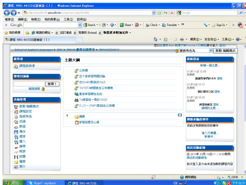
圖 2【99 第一學期日語會話一 Moodle 頁面】

誠如表 1 所顯示的；應用日語學系對於 Moodle 平台的利用至少經過兩年以上的摸索期，才逐漸普遍被教師接受並且善加利用。對於電腦或數位專業並不專精的大部分文科系教師而言，第一次接觸到數位教學平台需要一段時間的摸索與適應是必然的。就筆者本身的經驗而言，一開始的時候幾乎是處於學習網頁工具的階段，至於如何善用工具是沒有餘力去思考的，因此當時的公佈欄幾乎是空白的，檔案也是在學校的要求之下草草丟上兩個應付了事，也許這是一個成長過程，不過現在回過頭來看，更能體會出一個好的系統或平台，沒有教師實質的去經營的話，工具便無法發揮其最大的功能。約莫經過了一年多的摸索，漸漸的簡單的功能操作了解了之後，我開始思考 Moodle 能為我的課程做什麼，於是我的公佈欄不再是空白，檔案數目也增加了，還有討論區、繳交作業等，雖然我目前使用的都還是基礎的功能，至於進階功能仍在繼續學習當中，希望以下的經驗分享對 Moodle 平台的推廣與日語教學有所助益。