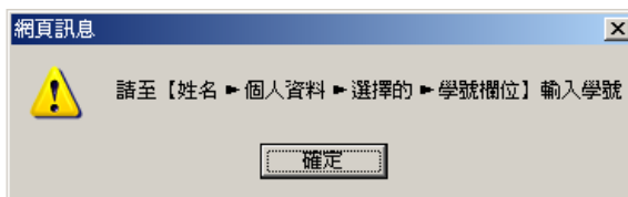
圖2 選擇學生身份後顯示輸入學號的路徑的訊息