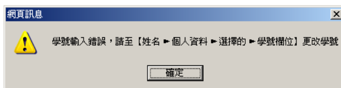
圖3 檢查已輸入學號的使用者的錯誤訊息