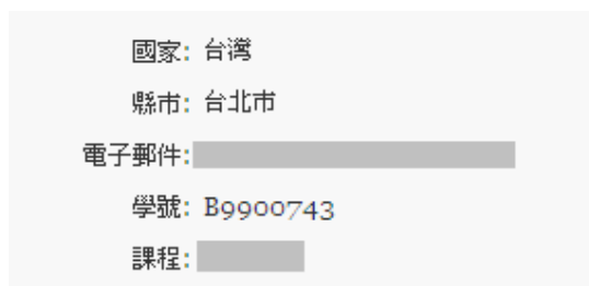
圖6 個人簡介內容顯示學號

在 e-Portfolio 的部份，採用兩個方案，第一個方案是採用開源軟體—Mahara。經過測試後，帳號能與 Moodle 做整合，但是僅能把 Moodle 上的討論區轉到 Mahara 上。若要整合到學校自行開發的 e-Portfolio 平台，需要花費許多功夫做整合的動作，此方案因此放棄改由第二種方案處理。第二種方案除了在前段說明把學號先做處理後，再進行資料庫處理。把使用者主檔需要使用到的欄位以及線上選課資料、討論區、作業、線上測驗、相關線上統計的功能匯到暫存資料庫[4] [5] [8] [9] [13]-[15]。