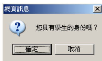
圖1 登入moodle後確認學生身份的訊息