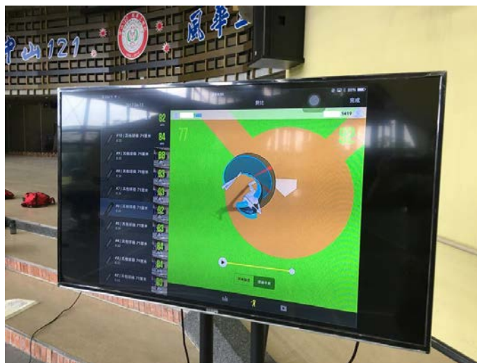
圖 2. 行動多媒體車與可視化資料示意圖

前、後測資料的收集主要讓學生進行 15 次揮擊，有效的揮擊主要是球棒要碰觸到球，當球棒把球揮擊出去後資料會開始進行雲端運算與分析，揮擊 15 次之後將數據取平均值，然後進行統計分析。